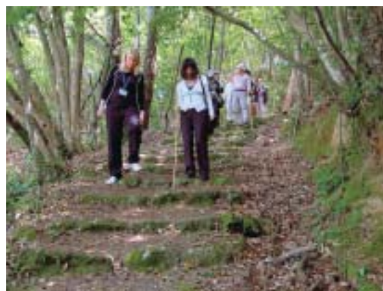
石見銀山街道 温泉津・沖泊道にて