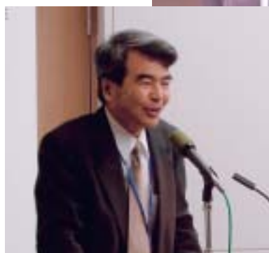
◀井澤英二氏 (九州大学名誉教授)