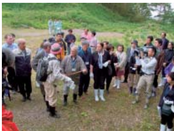
石銀藤田地区にて

大森銀山重伝建地区では代官所前から銀山公園まで歩き、途中で修復が進む重要文化財熊谷家住宅等を視察されました。午後には、近代に建設された清水谷製錬所の跡を訪れて斜面に残る石垣の遺構を見ていただいたあと温泉津町に移動し、銀山街道温泉津沖泊道を清水集落から「松山の道標」まで歩き、最後に沖泊集落を見ていただきました。街道の視察途中、専門家から何時作られた道か、街道の道幅に対してどこまで史跡指定されているか、どこまで緩衝地帯を考えているかなど、次々と質問が出ました。そして、石見銀山遺跡の構成資産として街道や港湾まで含めている点について、新しい視点であるとの評価が得られました。