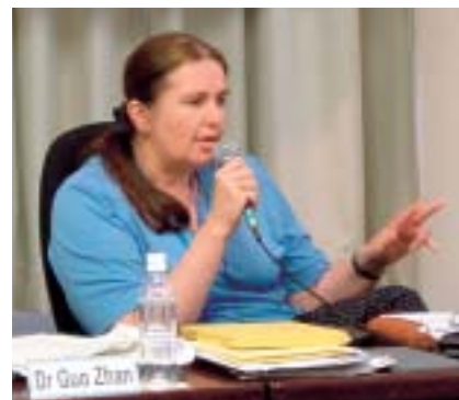
ヴィエラ・ドヴォジャークヴァ氏 (スロヴァキア遺跡管理局長)