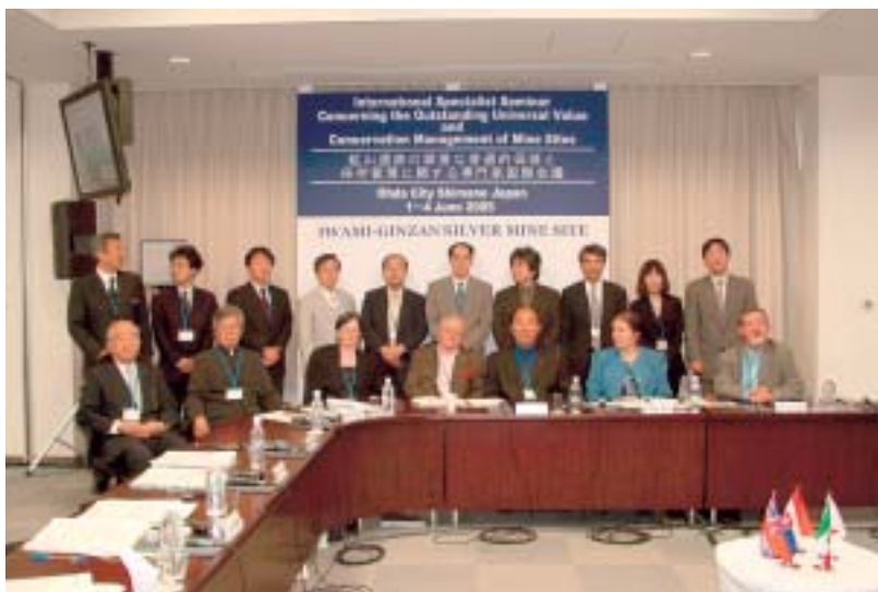
国際会議参加者2005.6.1 - 6.4

ヨーロッパや中南米には、ドイツのランメルスベルク銀鉱山やボリビアのポトシ銀鉱山など、世界遺産になっている金銀銅鉱山が10カ所ほどあります。東アジアにも主要な鉱山遺跡が複数存在していますが、これまで遺跡の価値に関する比較研究は進んでいませんでした。石見銀山遺跡も、16世紀にヨーロッパで作成された世界地図にも名前が記載された日本を代表する鉱山遺跡ですが、国際的な評価が定まっているとは言い難い状況です。