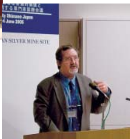
スチュアート・B・スミス氏 (国際産業遺産保存委員会事務局長)