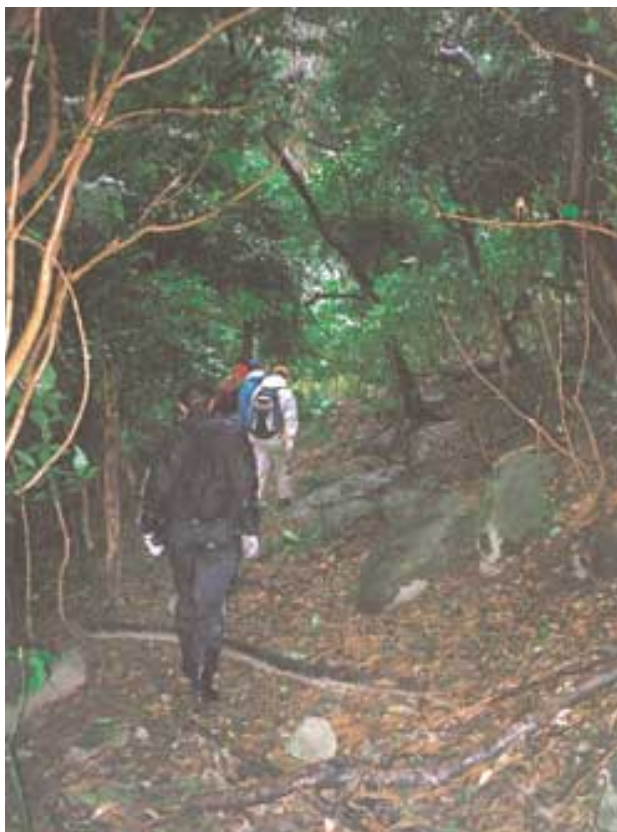
西谷・道面から稜井戸へ（馬路地区）。林の中の道を進む

戦国末期、銀の積み出しや物資輸送が降路坂を越えて沖泊（温泉津）経由で行われるようになると、鞆ヶ浦ルートの交通量は激減し、あまり利用されなくなると推定されます。そのため、今日では、街道がどこを通っていたのかははっきりしていません。しかし、元和3～5年（1617 - 19）制作の「石見国絵図」（浜田市教育委員会所蔵）には、銀山「はた（畑）口屋」から高山山麓を通り、馬路に至る街道が記されています。そこで、明治時代の地籍図や地