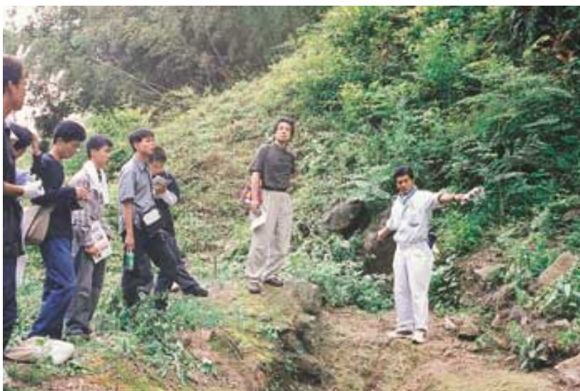
於紅ヶ谷地区の発掘現場で説明を受ける様子 (3日目フィールドワーク)

更に、この日の夜は会場を大田市内の「あすてらす」へと移し、一般公開講座「世界遺産とまちづくり」へ参加しました。会場は、圏域住民や受講生、さらに行政職員を含む250名で埋まりました。講師には、世界遺産について国内で最も事情に詳しい西