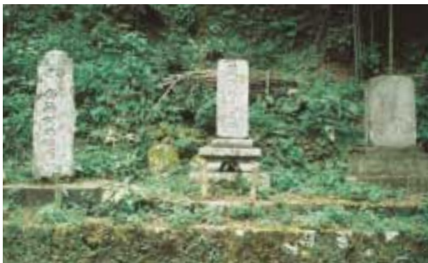
副道夷険碑ほか3基の石碑が並ぶ西田地区

沖泊ルートの調査で判明している事をいくつか紹介します。沖泊から松山の道標までは、道が数ルー