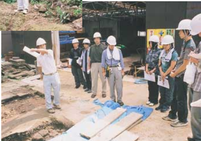
町並み最大の民家旧熊谷家で解体修理作業を見学 (3日目フィールドワーク)