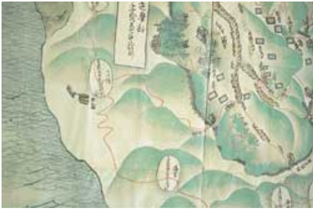
元和『石見国絵図』浜田市教育委員会蔵（馬路付近）

積み出しルートであったとされます。しかし、このルートは、16世紀の半ば以降、毛利氏が石見を支配するようになって概ね温泉津沖泊方面が幹線交通路になり、積み出しルートとしての地位を低下させたか、もしくは失った可能性があります。そのせいか、沖泊ルートに比べて、現状では、かなり手がかりが少ないのです。