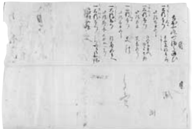
高野了喜書状（年未詳9月晦日）の紙背文書