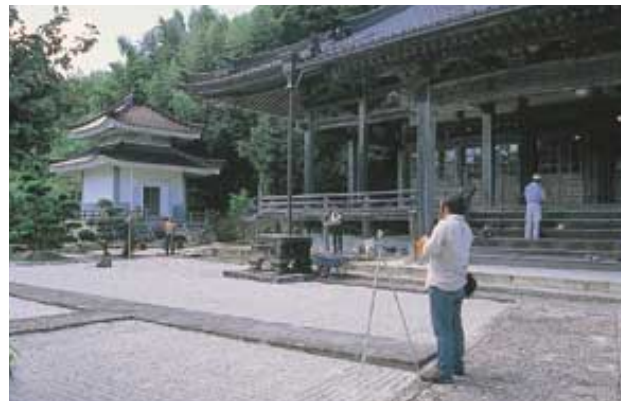
仁万天河内 満行寺

8月28日から31日までの4日間、1回目の建造物調査をおこないました。初日は午後から仁摩町甘子谷の鉱夫長屋（中本家）を実測しました。石見銀山は大正12年に閉山しましたが、昭和12年に軍が再興を命じたので、試験掘りをおこなうために、この長屋