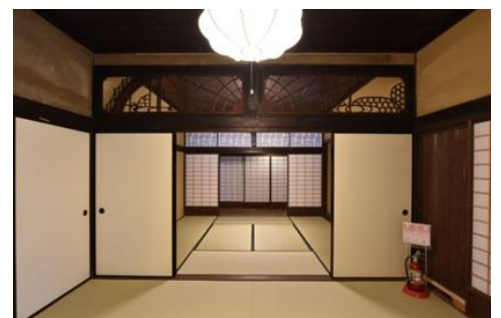
主屋（ゲンカン・オモテ）