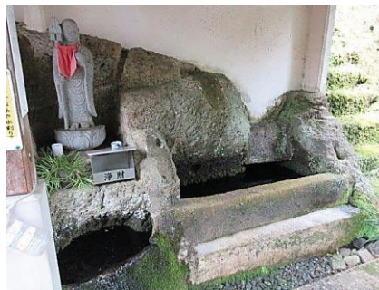
三百水 島根の名水 100 選

〒694-0305 島根県大田市大森町 804 TEL：0854-89-0005 HP：http://www.rakanji.jp