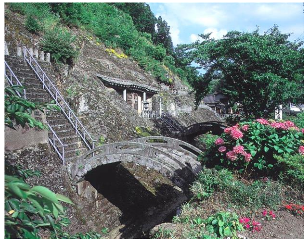
五百羅漢に掛かる反り橋

石見銀山遺跡にユニークな雰囲気をつくる五百羅漢は、昔銀山で働いて亡くなった人々の霊や祖先の霊を供養するため、多くの方の協力の元、八代將軍徳川吉宗の次男田安宗武卿の援助で明和三年(1766)、二十五年かけて完成しました。左右の石窟に 250 体ずつの石仏として安置されており、今でも当時の姿を見ることが出来ます。当時より五百羅漢にお参りすれば亡くなった両親、わが子の面影に会えるといい今でも参拝が絶えません。